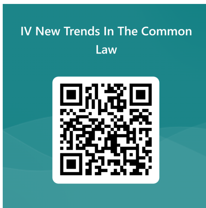
QR Code - Formulário de Inscrição

3.3 A inscrição será online e realizada através do link ou QR Code: https://forms.office.com/r/B63JjXVSjy , no período do dia 08 de agosto de 2023, a partir das 17h, até o dia 16 de agosto de 2023, encerrando às 23h59.