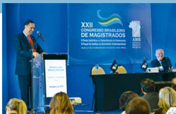
Ministro Luís Roberto Barroso na palestra de abertura do XXII CBM

O ministro enfatizou que não há estrutura que dê conta de tamanha demanda. “O volume ultrapassa a capacidade física razoável das pessoas. E o maior cliente individual é o poder público, que litiga de forma que sobrecarrega o sistema e faz mal para a Justiça. Ninguém pode achar que o litigio seja a forma natural de viver a