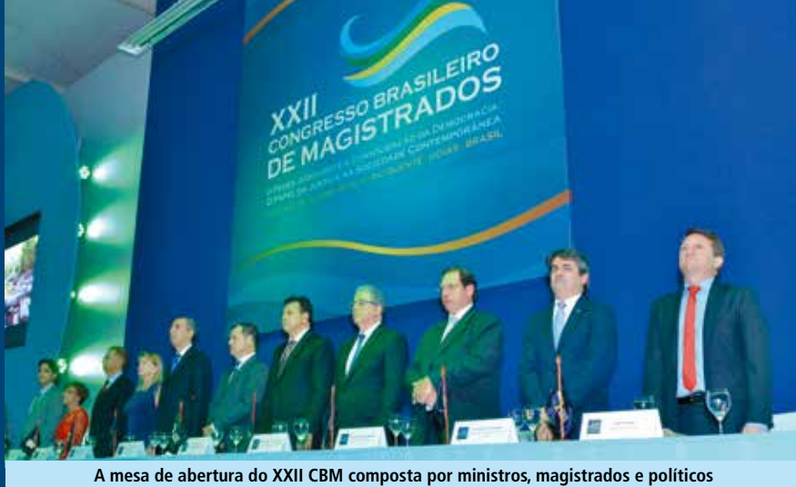
A mesa de abertura do XXII CBM composta por ministros, magistrados e políticos