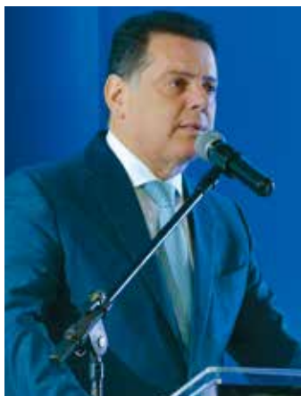
Governador de Goiás contou que seu Estado já aderiu ao projeto de audiência de custódia

O primeiro a falar sobre “Segurança Pública e o Poder Judiciário” foi o governador de Goiás. Depois de dar