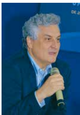
O diretor e professor da FGV-SP Oscar Vilhena

Para ele, o Supremo tem competências superlativas – o que deve ser revisto. “O STF é um tipo muito diferenciado de Corte de ápice. Acumula funções de Corte constitucional, tribunal de apelação, tribunal de instância especializada das autoridades mais importantes do país. Não conheço outro tribunal do mundo que acumule estas funções. É preciso que haja uma reforma de natureza institucional para desconcentrar poderes das mãos do STF. Ele precisa, por exemplo, deixar de ser um órgão recursal”, defendeu.