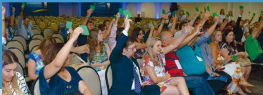
Associados votaram e discutiram as teses apresentadas