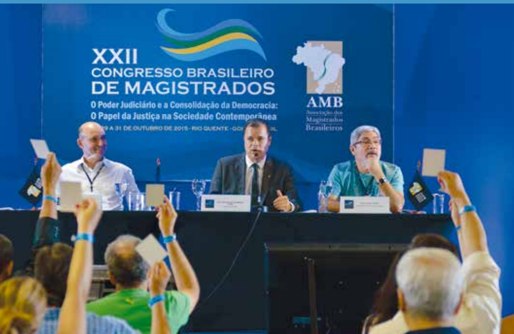
Magistrados aprovaram Carta de Rio Quente no encerramento do congresso