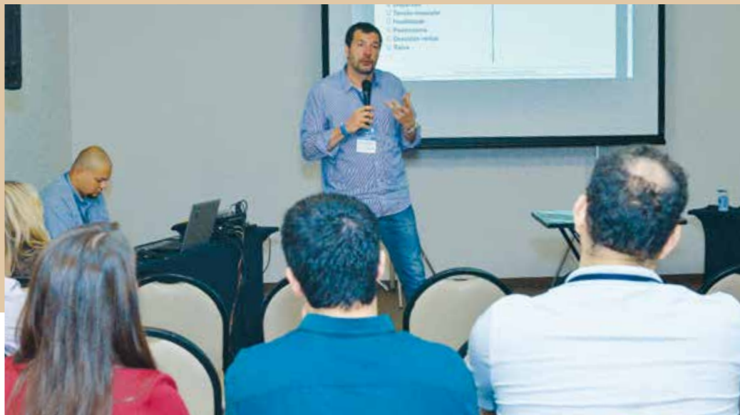
Para André Gomma de Azevedo, deve-se ver o conflito de forma natural

O juiz auxiliar da presidência do Conselho Nacional de Justiça (CNJ) André Gomma de Azevedo realizou a oficina Técnicas de Mediação e Conflito para os participantes do XXII Congresso Brasileiro de Magistrados.