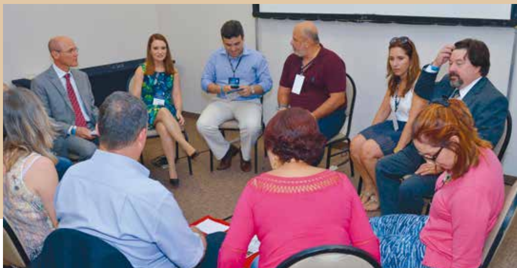
Magistrados durante a oficina Círculo de Justiça Restaurativa

Juízes de todo o Brasil presentes no XXII Congresso Brasileiro de Magistrados puderam conhecer umas das campanhas desenvolvidas pela AMB, a da Justiça Restaurativa do Brasil: a paz pede a palavra. O projeto tem como principais objetivos a pacificação de conflitos, a difusão de práticas restaurativas e a diminuição da violência.