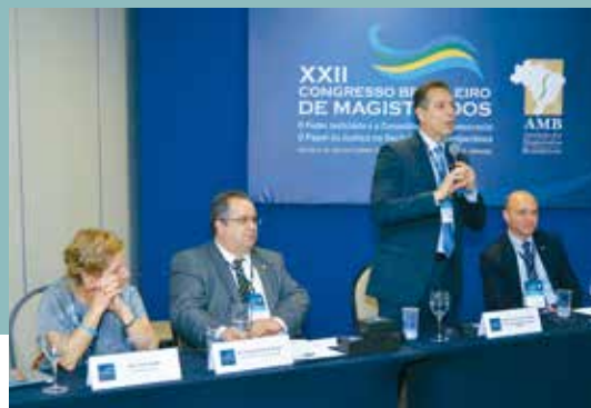
Gervásio abordou sobre o Judiciário e a imprensa e os desafios