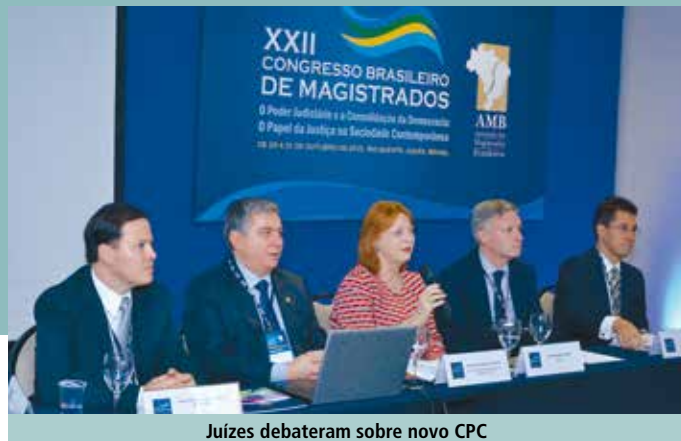
Juizes debateram sobre novo CPC