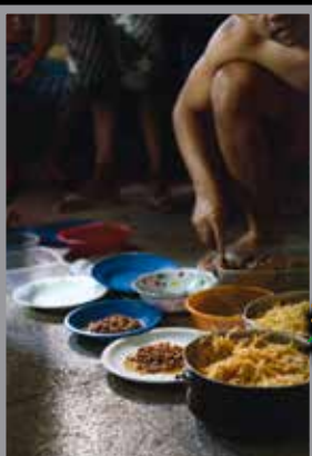
Foto: "A força da fé na ressocialização dos detentos", de Wagner José de Abreu Pereira