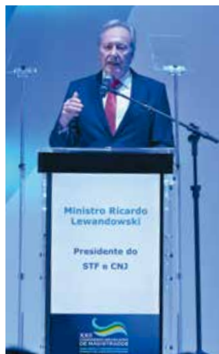
O presidente do STF e do CNJ ministro Ricardo Lewandowski

"A grade científica é estratégica na definição do papel da magistratura brasileira para construir uma nação nos moldes definidos pela Constituição cidadã. As discussões estarão na órbita das seguintes indagações: Qual é o papel dos juízes e