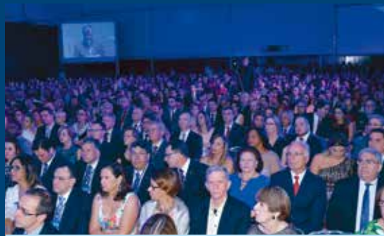
Mais de 1.500 pessoas prestigiaram a abertura do evento

juízas brasileiros na consolidação da democracia na sociedade contemporânea? O que os destinatários dos nossos serviços esperam do Judiciário? [...] É permanente o desafio de reinventar as nossas instituições e o Poder Judiciário, na atual quadra histórica, figura na condição de destinatário da maior tensão social, porque cabe a ele a tarefa de realizar as promessas do último movimento constituinte".