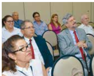
Congressistas estavam atentos à explanação do juiz auxiliar da presidência do CNJ

Gomma mostrou alguns exemplos de situações reais e instigou os juizes a usarem técnicas específicas para resolverem as discussões e desavenças que enfrentam no dia a dia. "A principal preocupação é ver o conflito de uma forma